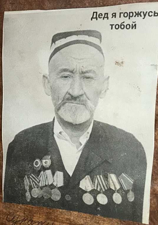
Дед я горжусь тобой